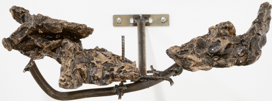
Lupo in decomposizione, 2024 terracotta smaltata e ferro / glazed terracotta and iron 31 x 12 x 40 cm