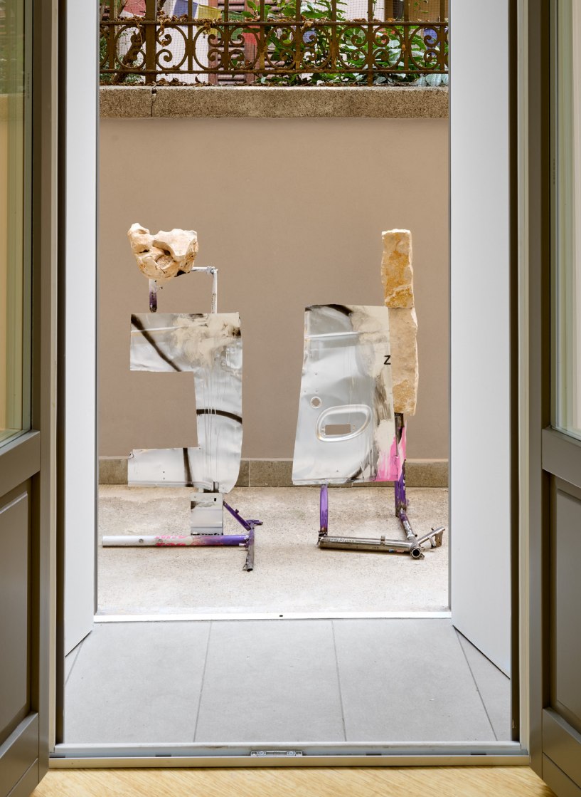
Remote viewer, 2023 frammenti di telai di bici e auto, pietra, smalto spray / bike and car frame fragments, stone, spray enamel 110 x 110 x 60 cm