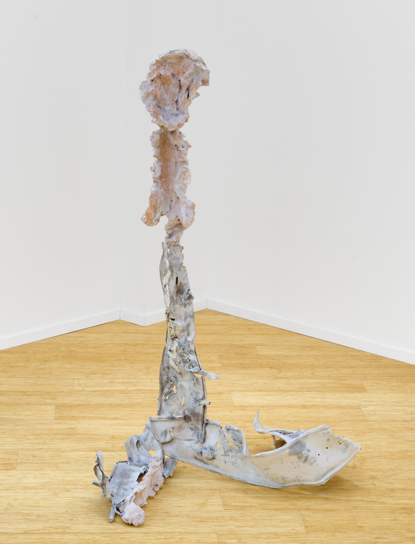
Untitled, 2023 lamiere in ferro, terracotta, smalto acrilico diluito, adesivi / iron sheets, terracotta, diluted acrylic enamel, stickers 114 x 50 x 60 cm