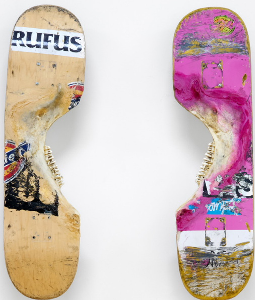
Appeared in the stone , 2020 tavole da skate, mascelle di vitello, colla, acrilico / skateboards, calf jaws, glue, acrylic dimensioni variabili / variable dimensions