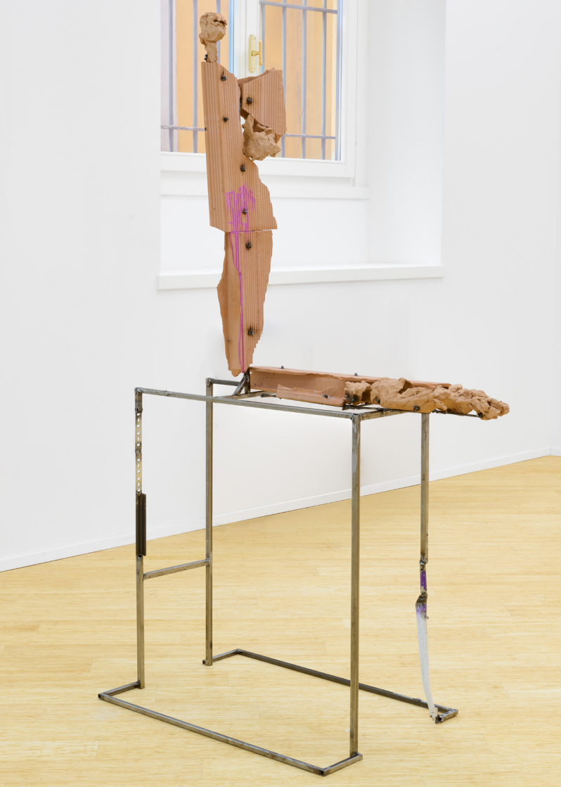
Untitled, 2023 ferro, terracotta, mattone forato, smalto acrilico / iron, terracotta, perforated brick, acrylic enamel 30 x 170 x 105 cm