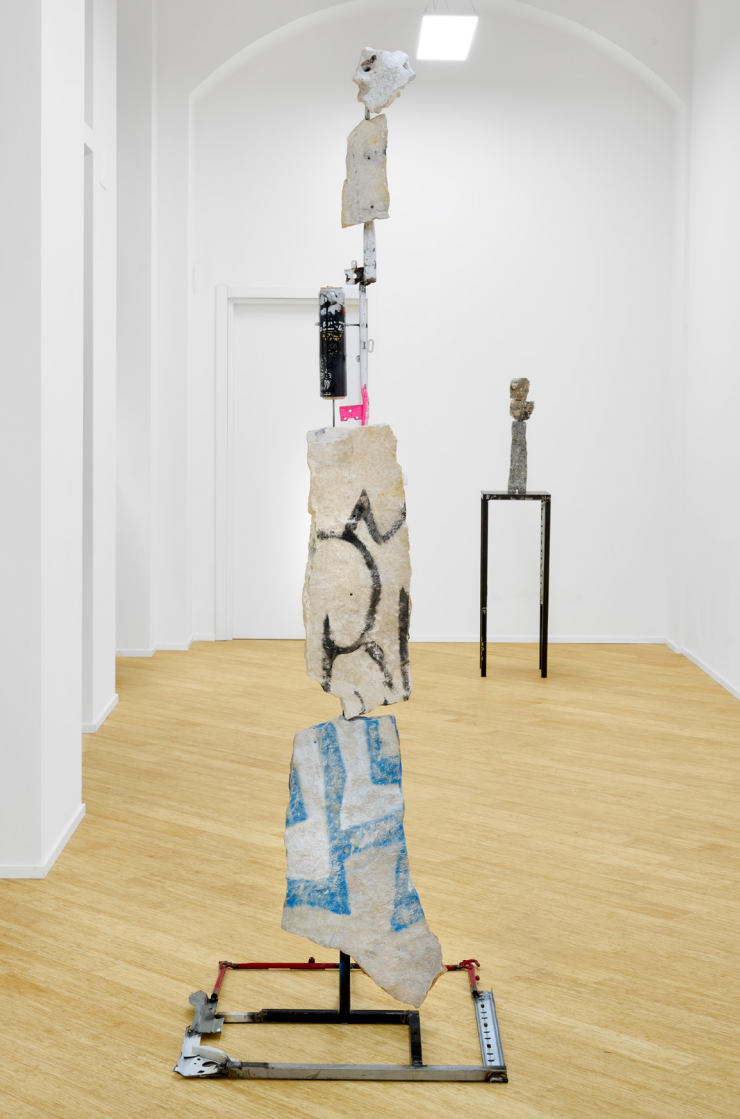
Apparizione di un secondo sole, 2023 ferro, pietra, alluminio, smalto spray / iron, stone, aluminium, spray enamel 70 x 70 x 230 cm